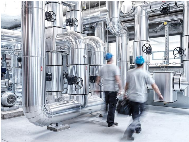
Mit Fernwärme investiert ewl in eine regionale und ökologische Wärmelösung.

Weitere Informationen zur Fernwärmeversorgung in der Region Luzern finden Sie unter www.ewl-luzern.ch/fernwaerme .